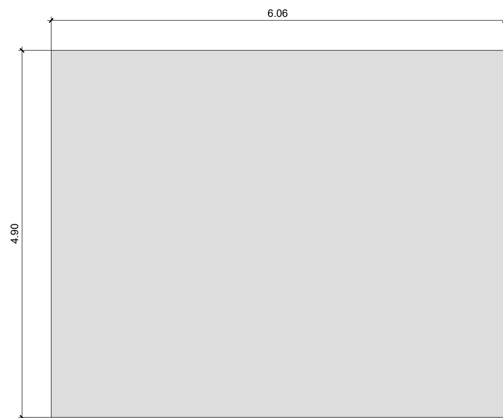
3 LAJE PRÉ-MOLDADO ESC.: 1/50